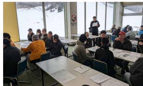
従業員教育勉強会風景