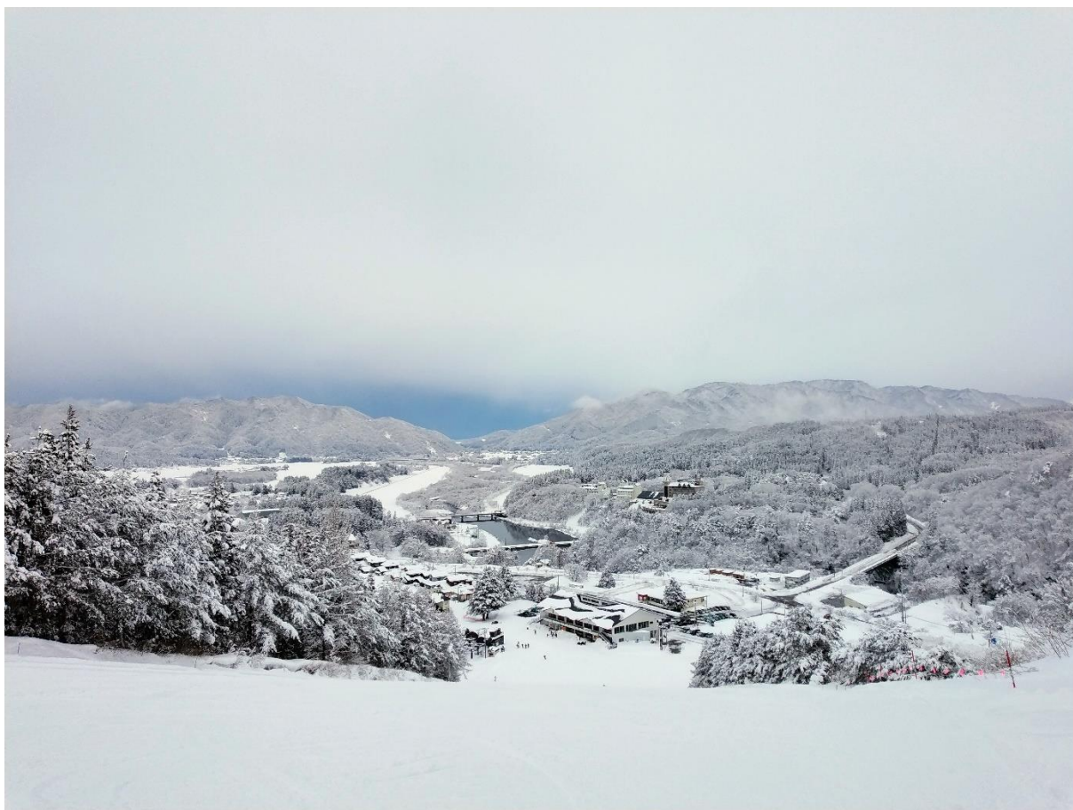
胎内スキー場：カモシカゲレンデから望む胎内ロッジ